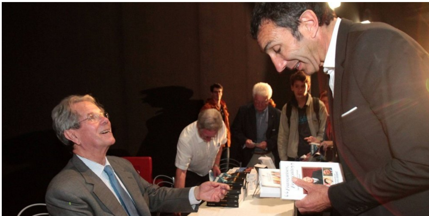
Jean-Louis Debré a aussi dédié ses livres.